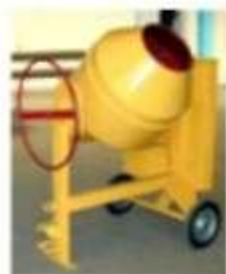
Бетоносмесители – 80%