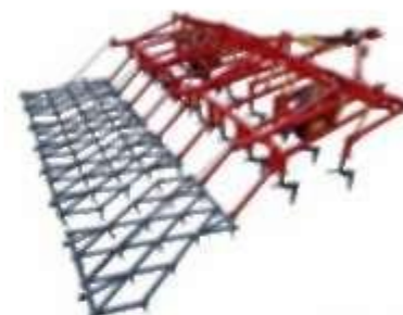
Культиваторы – 20%