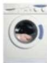
Стиральные машины – 34,7%