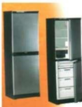
Холодильники и морозильники - 44,5%