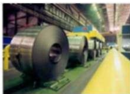
Сталь – 13%, в т.ч. кислородно-конверторная -22% Прокат черных металлов – 14%, в т.ч. холоднокатаный лист – 36%