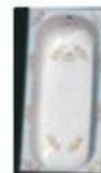
Ванны – 16%