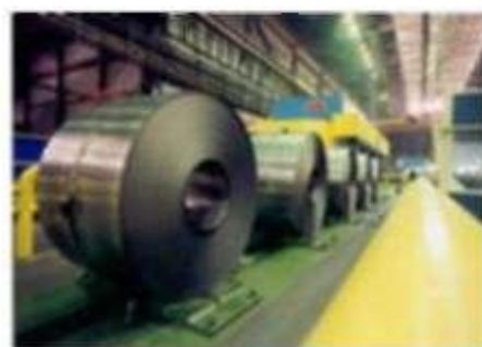
Сталь – 13%,