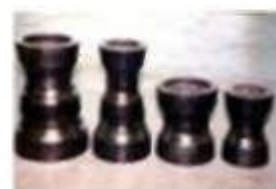
Арматура промышленная трубопроводная -20%