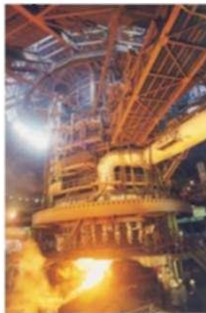
Чугун – 19%